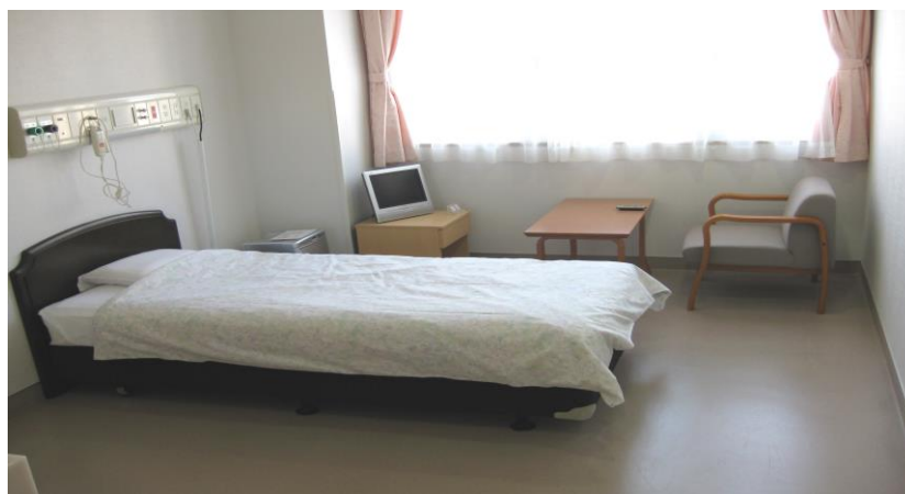
ドック室内に、雑誌、TV、フリードリンクなどをご用意しております